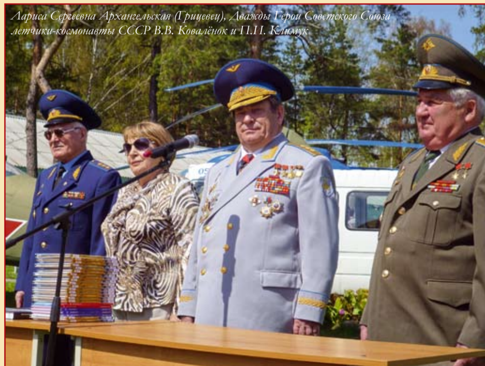
Лариса Сергеевна Архангельская (Грицевец), Дважды Герой Советского Союза летчики-космонавты СССР В.В. Ковалёнок и П.И. Климук